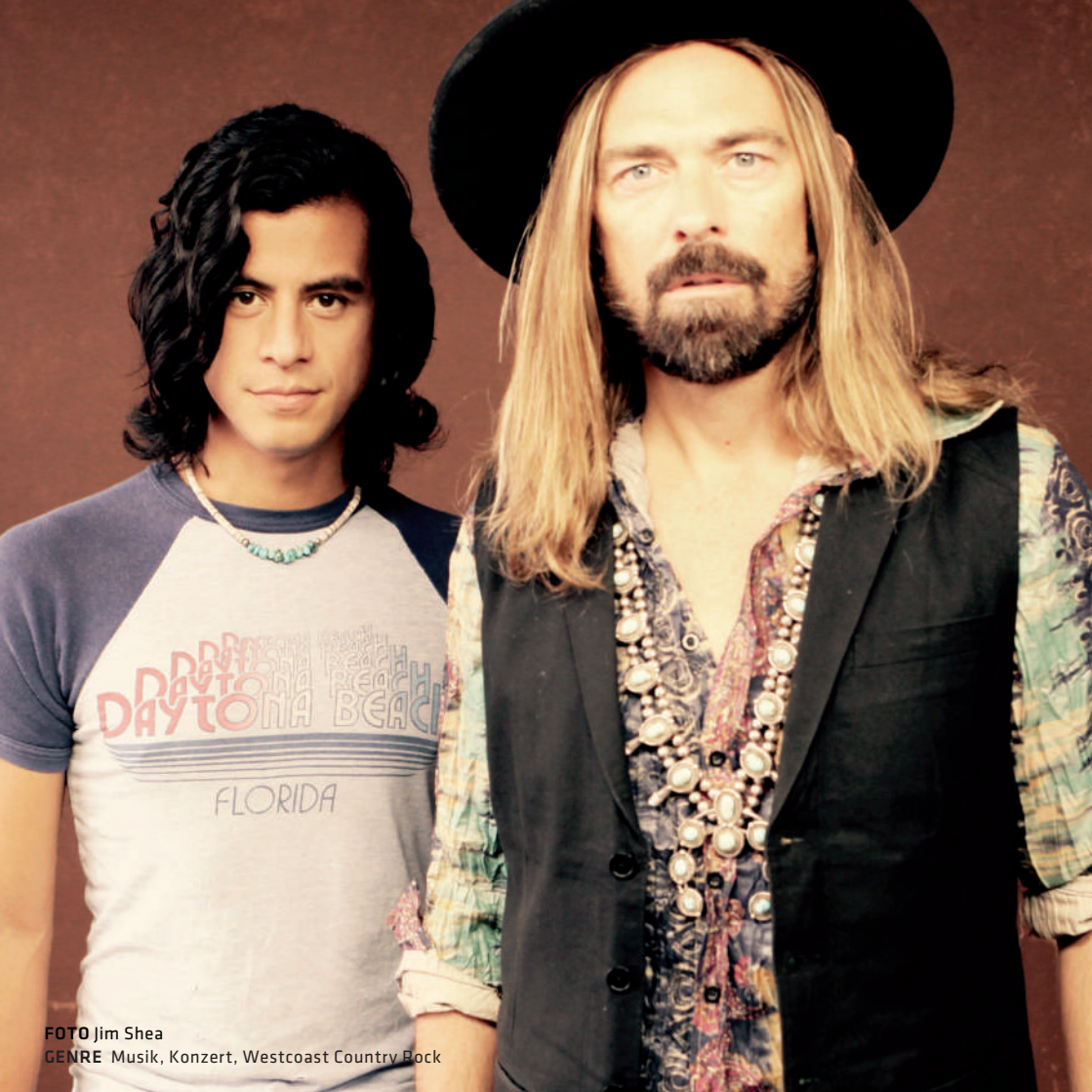
GENRE Musik, Konzert, Westcoast Country Rock