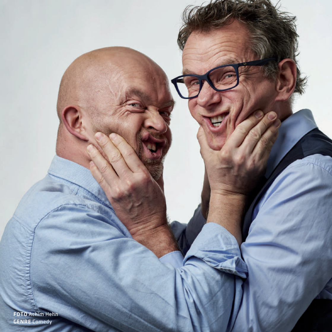
GENRE Comedy