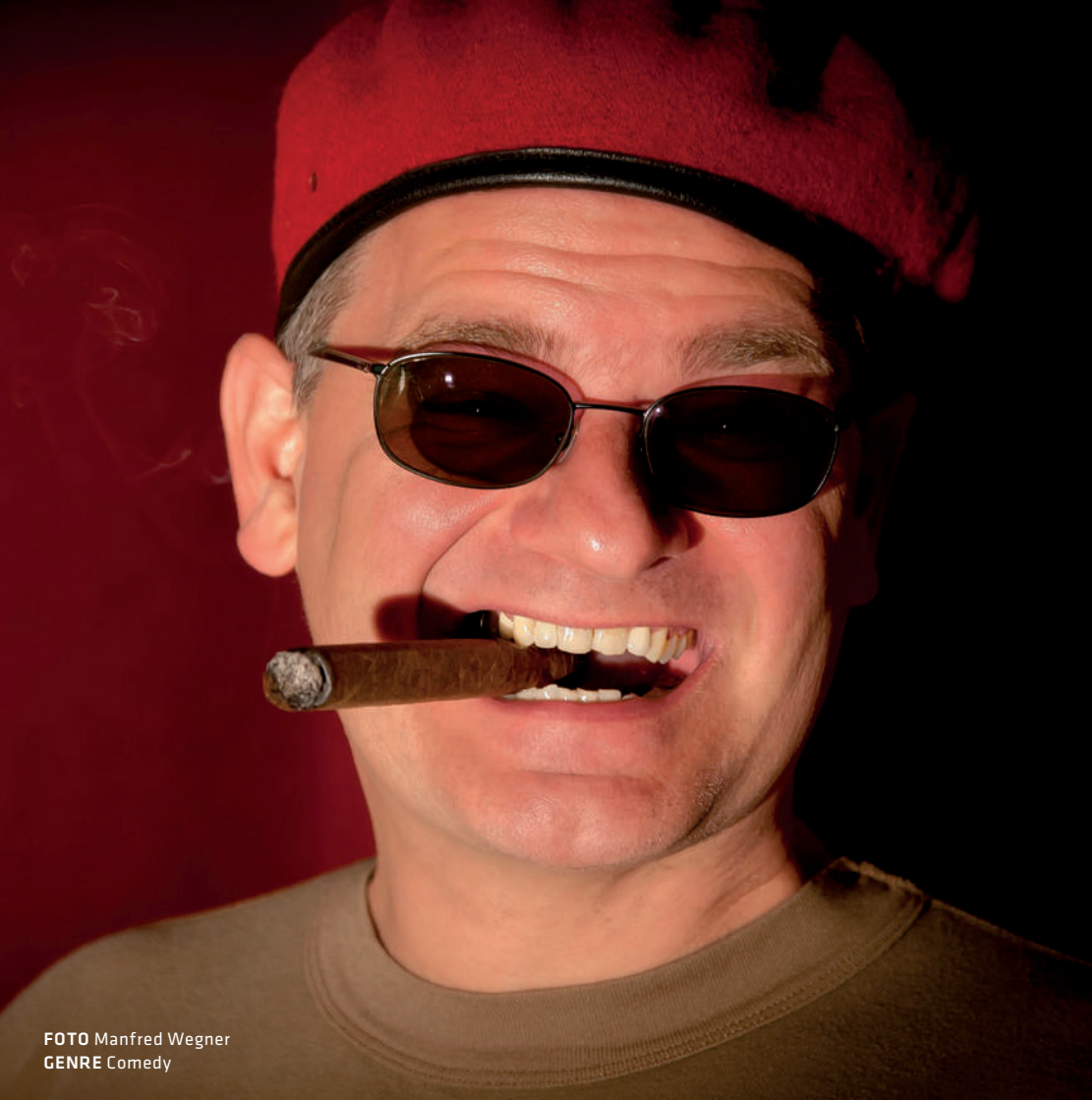
GENRE Comedy