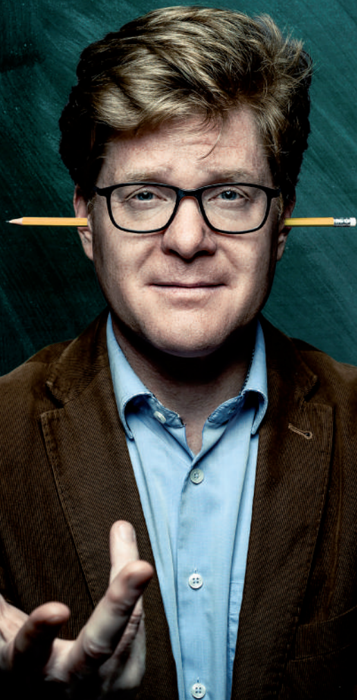
GENRE Comedy