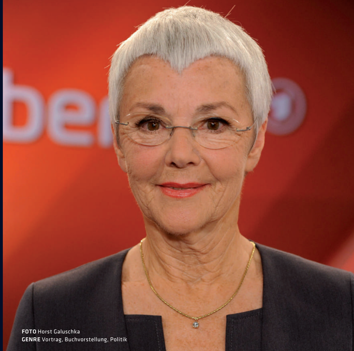
GENRE Vortrag, Buchvorstellung, Politik