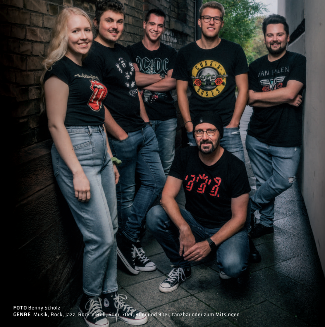
GENRE Musik, Rock, Jazz, Rock'n'Roll, 60er, 70er, 80er und 90er, tanzbar oder zum Mitsingen