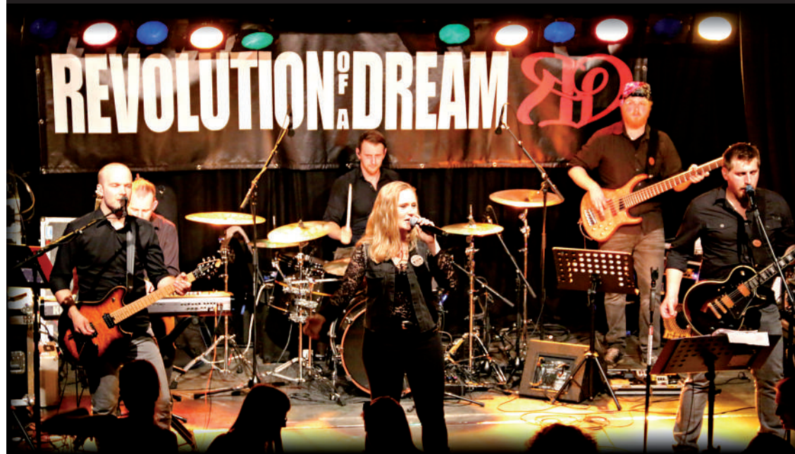
GENRE Musik, Rock, Hard Rock